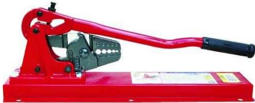
アームスエージャー ベンチ タイプ HSC-600BB